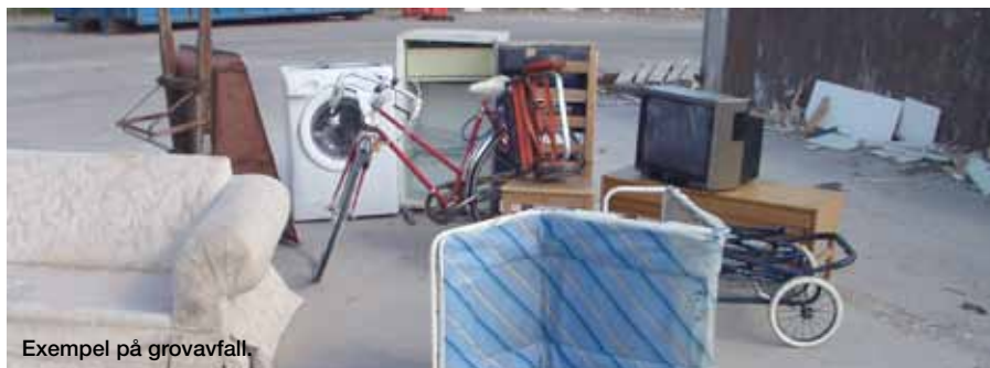
Exempel på grovavfall.

Vi hämtar inte avfall i säckar eller i kartonger, återvinningsbart (tidningar, kartonger, plastförpackningar), farligt avfall, byggmaterial (rivningsmaterial). För mer information, se Renhållningsinfo 2011 eller www.kumla.se/avfall