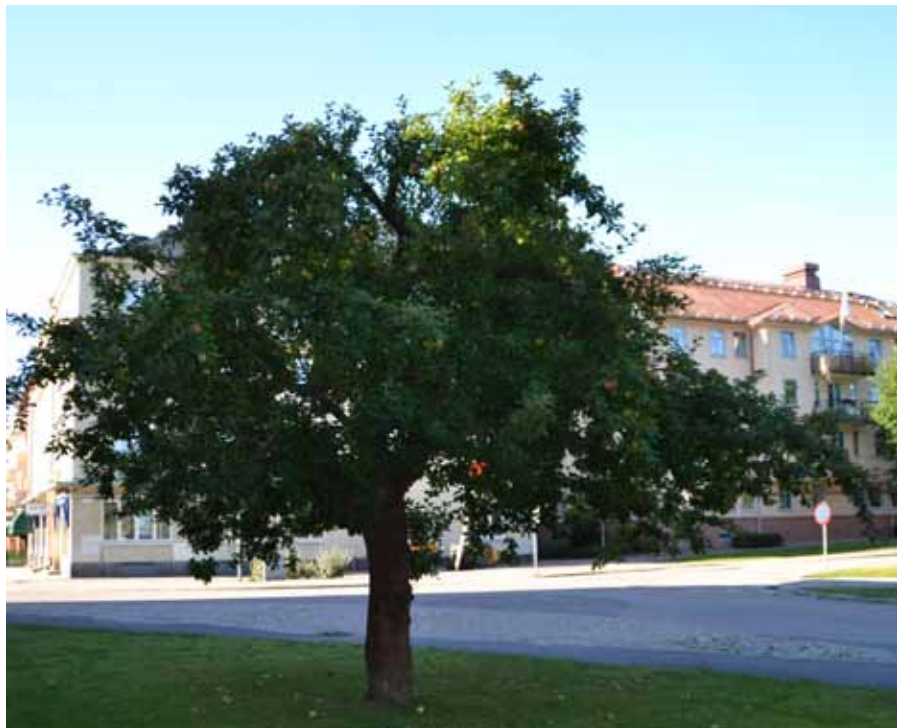
På västra sidan av stadshuset växer ett träd med äpplen av sorten Cox Pomona.

När hösten nalkas är det fritt fram att plocka de äpplen som finns i våra parken. Så lycka till och hoppas att just du hittar en sort som fallar dig i smaken. ■