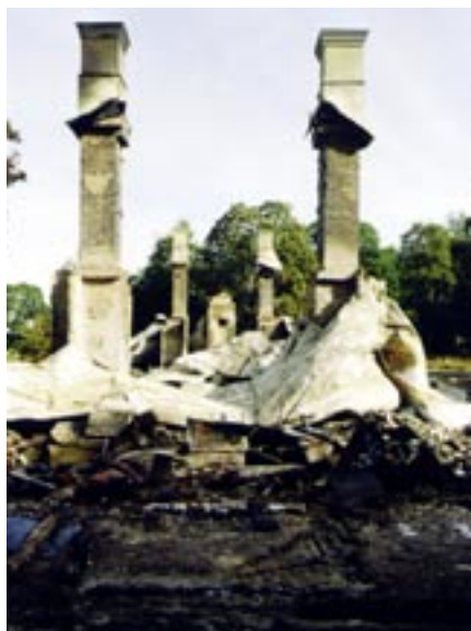
På brandplatsen reser sig fem skorstensstockar medan det falsade plåttaket sjunkit ned och döljer järnresterna från postdiligensen, kokvagnen m.m..