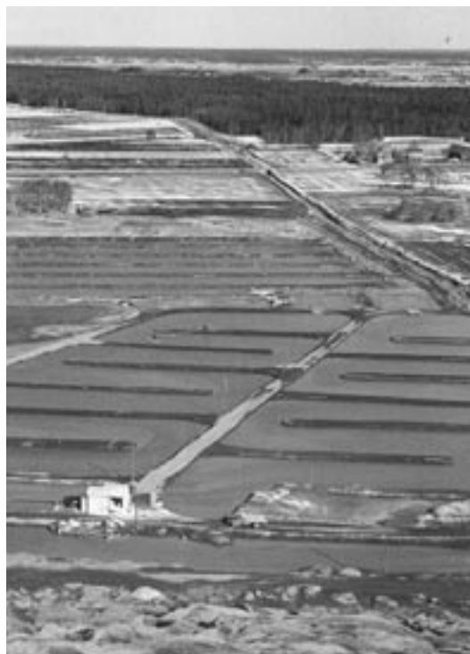
Vattenreningssystemet som det såg ut när det var nyanlagt.

Projektet beräknas kosta drygt 30 milj. Åtgärderna finansieras av staten, kommunen står för projektledning. ■