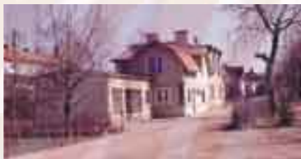
Johannes Kyrkogata. Bilden är tagen mot öster 1968. Stuvaffären Textillagret. Tillbyggnaden närmast kameran inrymde tidigare Sartz Skoaffär. Fredås Manufaktur längst bort.