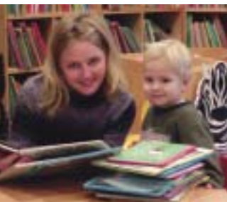
Både stora och små trivs på Kumla bibliotek.