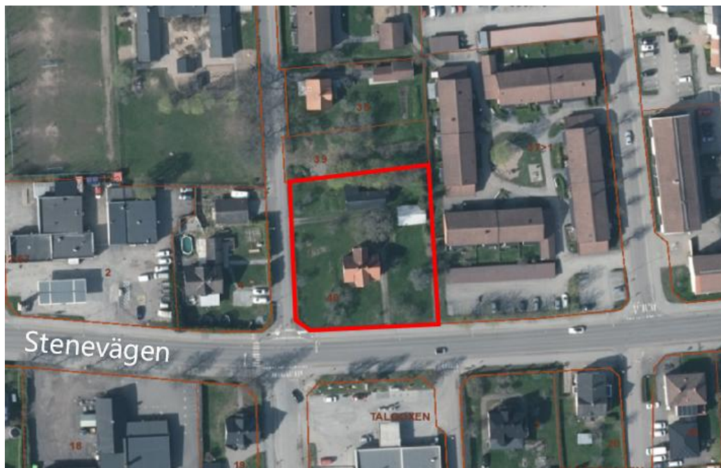
Planområdet avgränsad med röd linje.

Området är beläget i västra delen av centrala Kumla och begränsas i norr av fastigheten Sparven 39, i öster av fastigheten Sparven 37, i söder av Stenevägen och i väster av Villagatan. Planområdets areal är ca 2 700 m 2 .