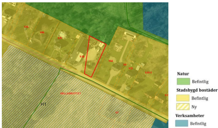
Utdrag ur Kumla kommuns översiktsplan.

Detaljplanens syfte och användningen strider mot den gällande översiktsplanen. Men ändringen bedöms att vara liten och att hela fastigheten får en enhetlig användningsbestämmelse.