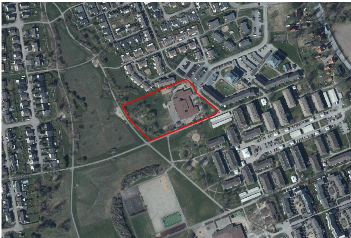
Karta med markerat planområde