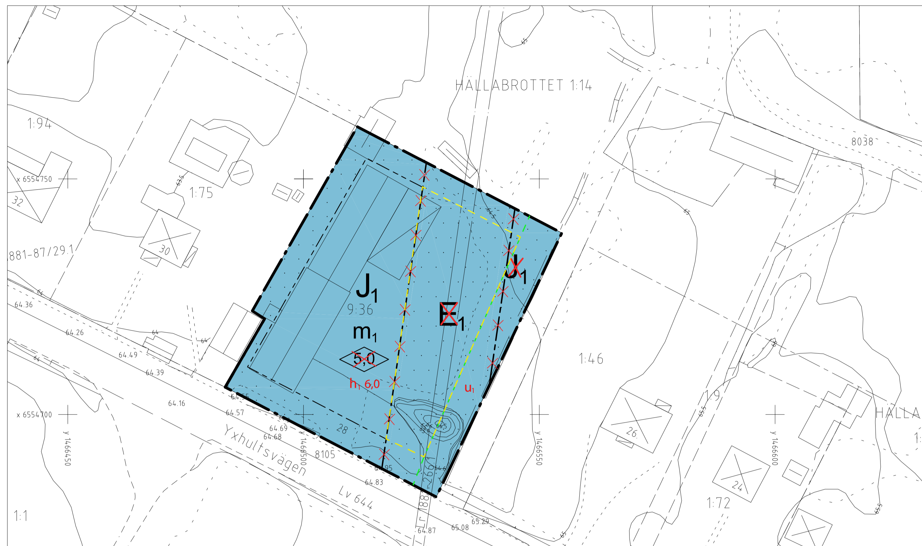
Planområde skala 1:500