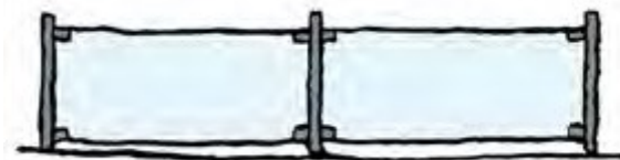
Metallstolpar med glastrutor

Inhägnader ska vara låga och diskreta och anpassas till platsens förutsättningar. Enkla smidesstaket, pollare med kedjor, rep eller markisväv är exempel på lämpliga avgränsningar. Trästaket av traditionell villamodell eller staket i tryckimpregnerat, sågat virke bör undvikas.