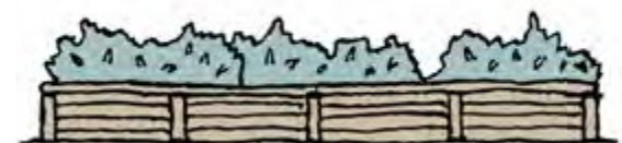
Plantering i lådor

Inhägnaderna ska ha en stabil utformning med exempelvis en tung fot riktad in mot serveringen. Förankring i marken får inte ske genom borrar eller liknande i betongplattor, asfalt, gatsten eller liknande. Om du måste förankra i marken, kontaktar du först oss på kommunen.