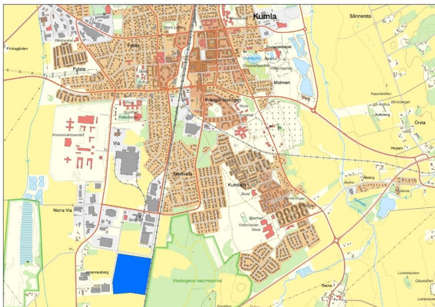
Planområdets läge i förhållande till Kumla tätort.

Området är beläget i sydvästra delen av tätorten Kumla, i Södra Via, i norr avgränsas av Vissbergagatan, i väster avgränsas av Byrstagatan, i öster avgränsas området av järnvägen och i söder ett dike. Planområdet har en areal på ca 11,5 ha.