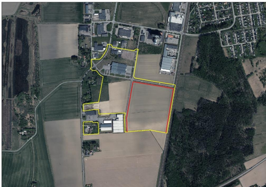
Gällande detaljplan markerat i gult och det röda området illustrerar den delen som ska ändras.